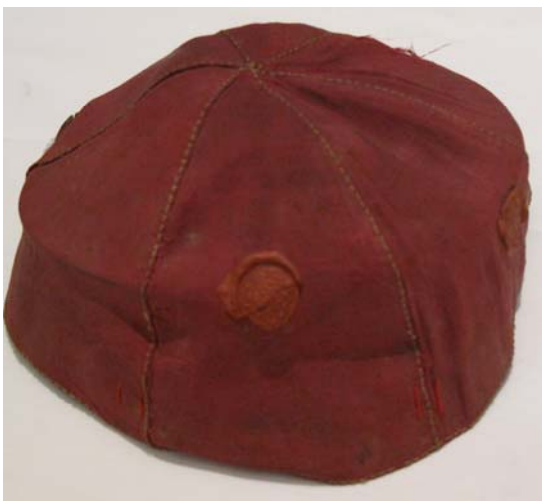
Guante y solideo de San Gregorio Barbarigo (1625-1697), cardenal y obispo de Padua (1664-1697), del relicario de la Catedral de Valencia. En ellos pueden apreciarse la inscripción y los sellos que los autentifican. El solideo lleva la inscripción en la parte interior.