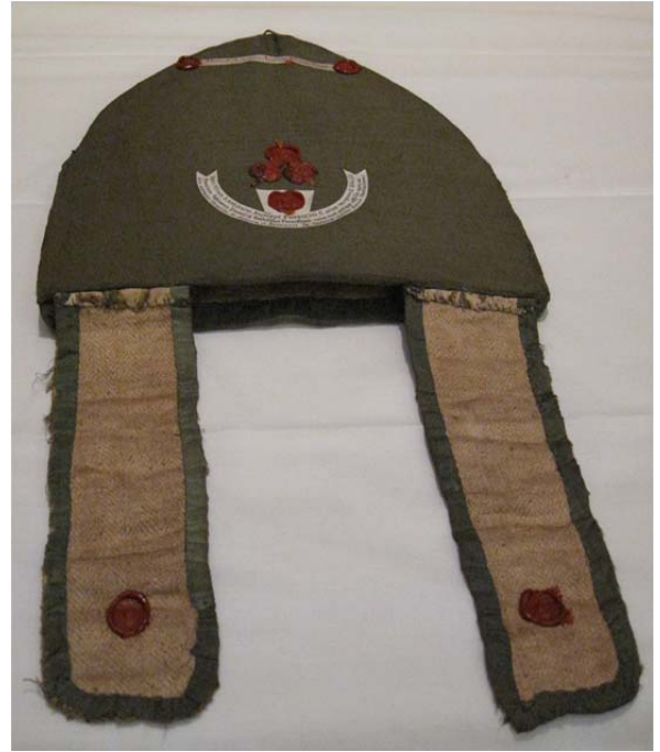
Imagen anterior y posterior de la mitra de San Antonino (1389-1459), arzobispo de Florencia, en la que también pueden observarse los sellos que la autentifican (en la parte superior), y otras reliquias de san Vicente mártir, conservadas en el interior del relicario de la Catedral de Valencia (imágenes de la parte inferior)