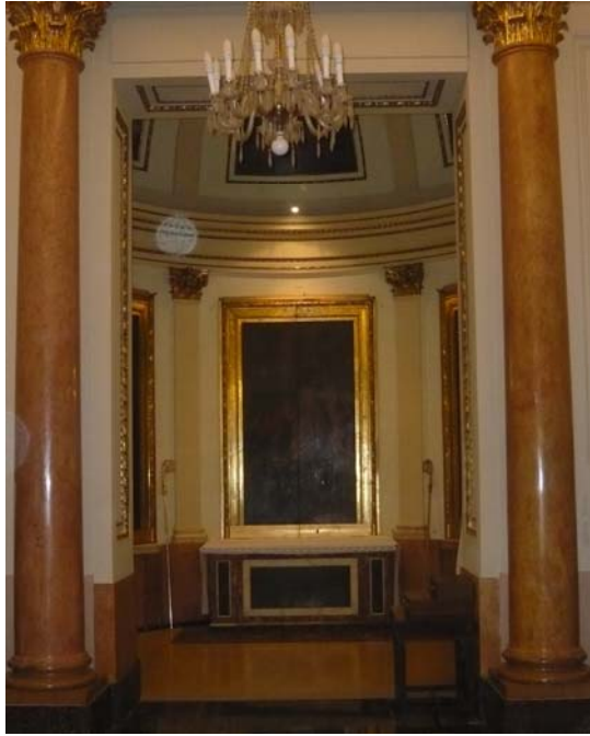
El relicario de la Catedral de Valencia, en el interior del Aula Capitulare, donde se abren tres grandes armarios que guardan las reliquias.