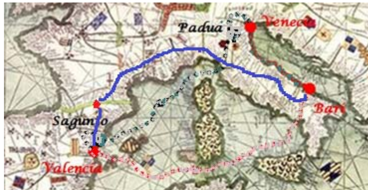
Posible ruta seguida por el obispo Teudovildo por vía terrestre, si se rechaza la opción marítima

En este caso, si el obispo parte hacia su destino con un desplazamiento terrestre, existe una remota posibilidad de su paso por la población francesa de Castres, situada en el departamento de Tarn y en la región de Mediodía-Pirineos, a 42 kilómetros al sudeste de Albi. Esta hipótesis daría verosimilitud a la tradición sobre la existencia de unas reliquias de san Vicente mártir en dicha ciudad. Castres se convirtió en una parada importante en las rutas internacionales del Camino de Santiago (a través de la Via