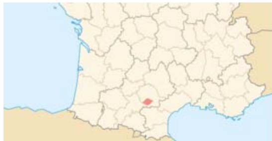
Situación aproximada de la ciudad de Castres