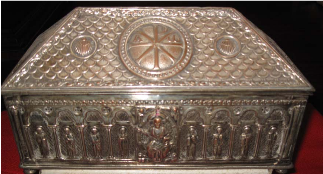
Urna de estilo bizantino, con reliquias en su interior de varios santos. Posiblemente se trate de aquella a la que tantas veces hace referencia Zampieri en su correspondencia.