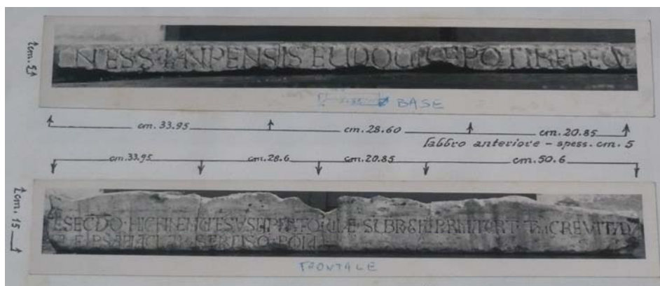
Fotografías de la inscripción, conservadas entre la documentación del fondo, con las medidas correspondientes de cada pieza. Anotaciones de Zampieri.

[Sobre la superficie más grande:] ET · SECVNDO · HIC · FINEM · VITE · SVSCIPIT · ATQ: VIAE: SVB · PVGILI · PARMA · VIRTVTVM · CREVIT · ADA... .... GIAE · PSAPIA · CLARVS · ERCISQ · POIA