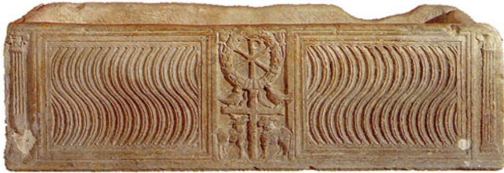
Sarcófago estrigilado llamado de "San Vicente Mártir"

de Bellas Artes con el de San Vicente Mártir, pero a pesar de ser una pieza posterior, no hay ninguna documentación que lo demuestre.