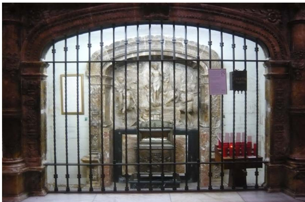
Capilla de la Resurrección, en la girola de la Catedral de Valencia, con la reliquia del brazo de san Vicente mártir