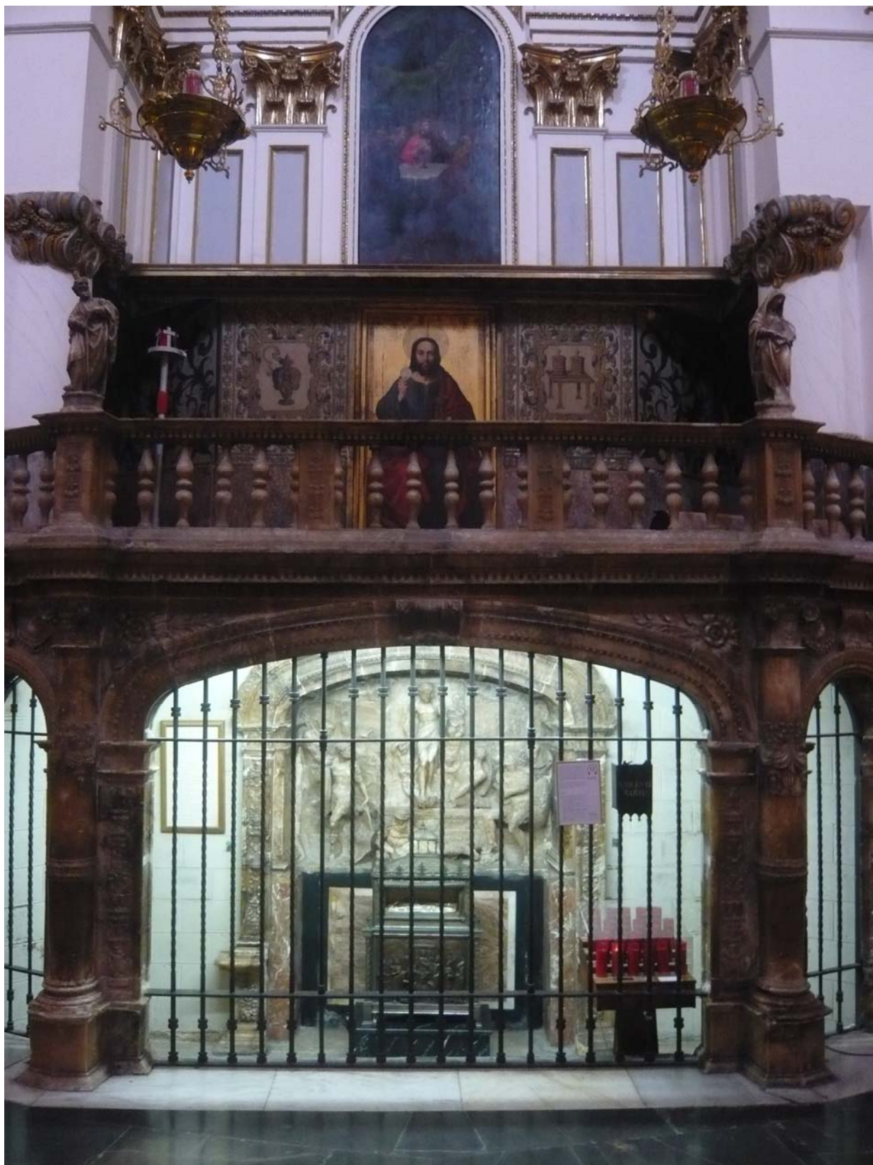
Vista del conjunto de la Capilla de la Resurrección, en la Catedral de Valencia, con el relicario de san Vicente mártir.