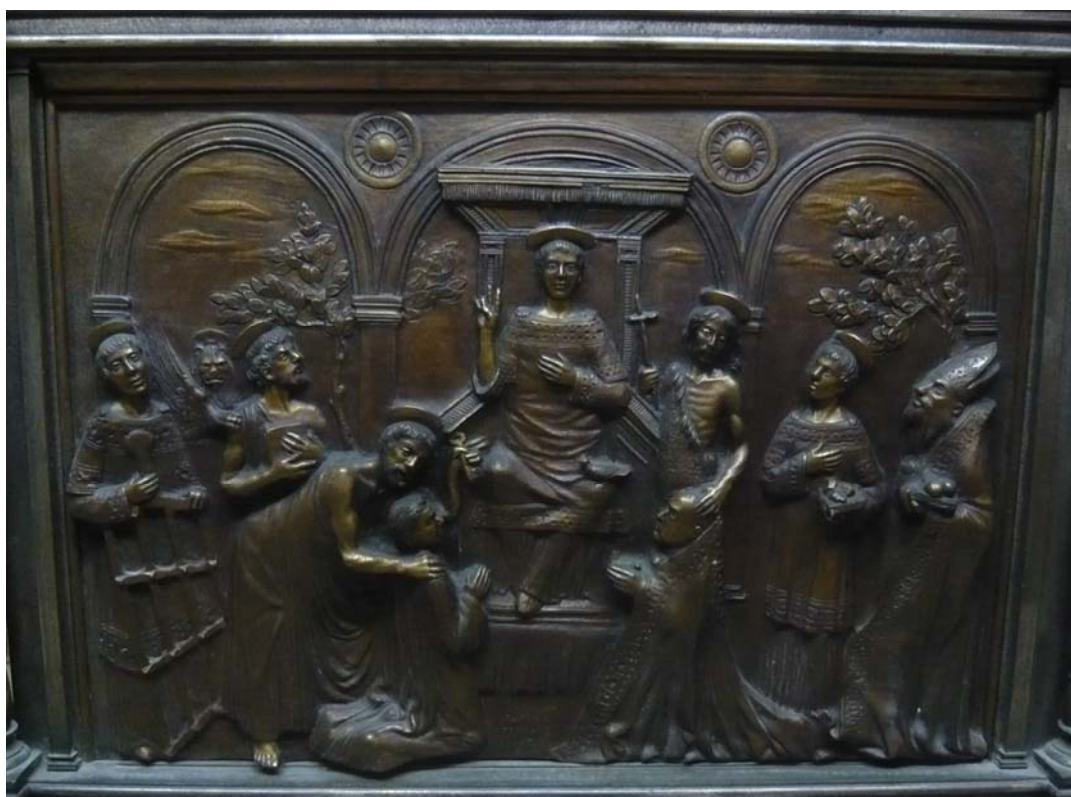
Detalle del bajorrelieve del relicario, con san Vicente en la parte central y el resto de las efigies descritas anteriormente.

Coronando la urna y rematando todo el relicario en su conjunto, la cruz de San Marcos, de Venecia, una alusión geográfica a las tierras en que estuvo por un tiempo esta reliquia, y también al tratarse de la ciudad del propio diseñador y orfebre del mismo.